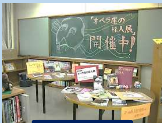
芸術鑑賞の事前学習