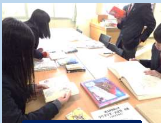
年中行事の調べ学習