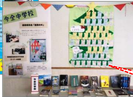
今金中学校「読書の木」展示

町内の廃校になった学校の記念誌なども展示し、BGM として学校の校歌を流すなど、様々な年代の来場者が楽しめる工夫を凝らしました。