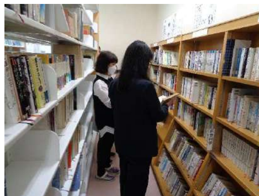
除籍する図書の確認