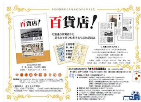
発行 PR チラシ