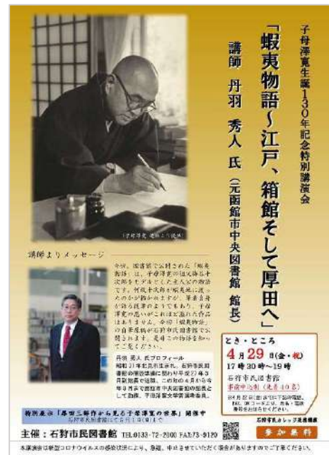
石狩市民図書館における講演会(2022年)の告知ポスター

公立図書館にとって、地元出身、地元に関連した作家の資料収集は使命の一つだと私は思っている。私が携わった石狩市民図書館の開館時、絶版品切れが多く悩まされた、石狩市にとっても最も重要な作家子母澤寛の本の多くが、当時既に手に入らなくなっていた。流通していたのは文庫を中心に十数冊程度で、絶版になっていた講談社の子母澤寛全集は古書店から購入した。私はしばらく市長部局に異動になって、図書館に戻った時、数年後に寛が生誕 120 年を迎えることに気づいた。記念企画をしたいと思っても、全集と若干の本では何もできない。地元の郷土史家に相談し、多くの初版本を含む 30 冊以上の単行本を寄贈してもらった。札幌の古書店サッポロ堂、弘南堂には子母澤寛に関わるものを集めてほしいと依頼すると、自筆原稿、書簡、色紙などを納品してくれた。このような資料は、特定の作家のもの以外は案外安く、図書館の資料費でも買える値段なのだ。そして、子母澤寛生誕 120 年の 2012 年、出生日の 2 月 1 日を挟む 5 カ月間記念展示を行ない、私が解説を書いた。