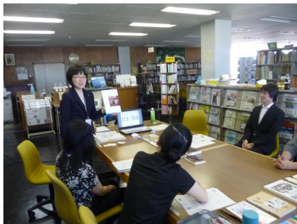
ビブリオバトル体験中！