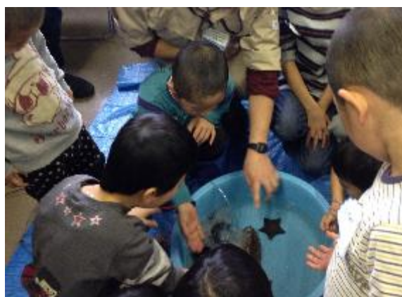
なんと、これ図書館の中！

図書館で水族館のことや、海の大切さ、生き物の不思議を味わい、実際に水族館で体験できる、大変すてきなコラボ企画となったようです。