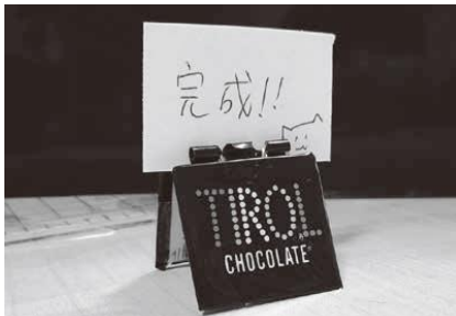
第 95 回 ぱっちゃんカードスタンドを作る 『お菓子のパッケージで作ろう！エコなグッズ エコ・文具』平田美咲著 汐文社

※平成 24 年 1 月号以降の広報は豊頃町のホームページからアクセスできます。