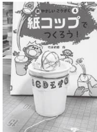
第 93 回 玉とばしをつくる 『紙コップでつくろう!』竹井史郎著 小峰書店