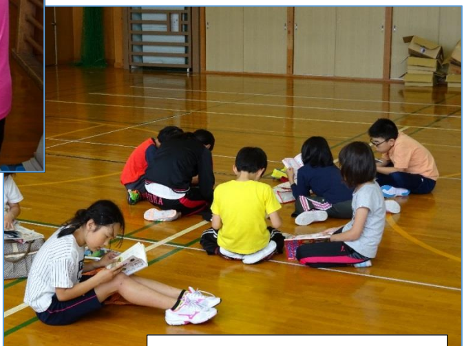
借りた本を夢中になって読む子どもたち

しかけえほんやおはなし迷路を楽しんでいる子ども達もいましたが、すぐに借りた本を読み出す子どもたちも多く見られました。