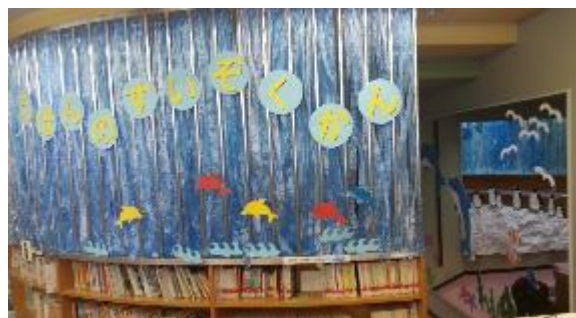
えほんコーナーが水族館に？