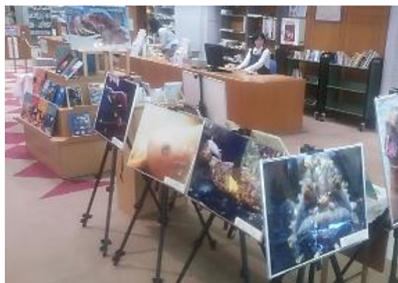
なんとも不思議な海の生き物が館内に登場！