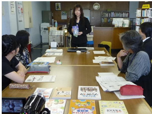
ブックトーク実演中！

最後の情報交換では、美唄市立図書館と学校との連携の状況について聞き取りを行いました。現在行っている学校への配本のほか、ブックトーク等も取り入れていけないか検討をしているとのことでした。