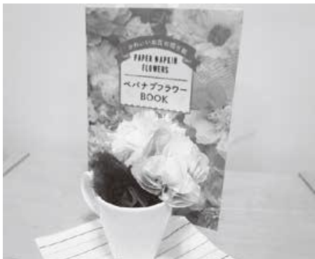
第 91 回 ペーパーナプキンを使ってカラフルな花を作る 『ペパナプフラワーBOOK』河出書房新社

ちなみに、第 1 回は「フェイクスイーツ」、第 100 回は「自動販売機」でした。連載開始当初から職員の代替わりを経つつも、まだまだ続く勢いです。