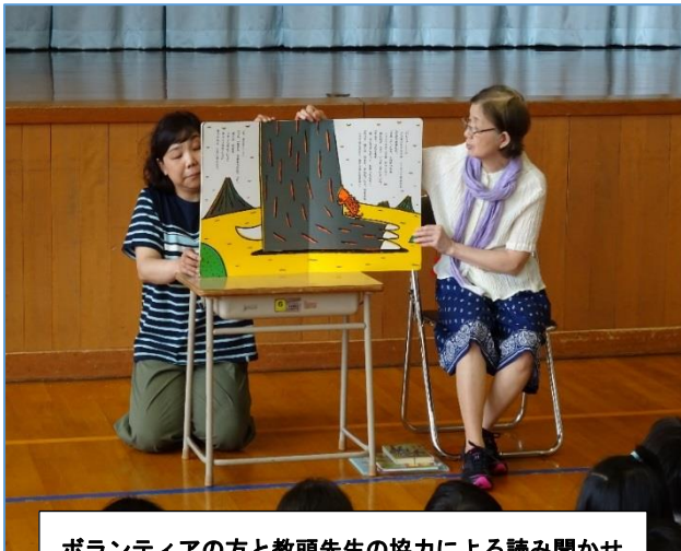
ボランティアの方と教頭先生の協力による読み聞かせ

学校ブックフェスティバルは、子どもたちに読書の楽しさを知ってもらうことを目的とし、道立図書館から大量の本を貸出し、体育館にランダムに並べた本の中から自由に選んでもらう事業です。図書館（教育委員会）、学校、ボランティア（PTA）が連携して実施します。