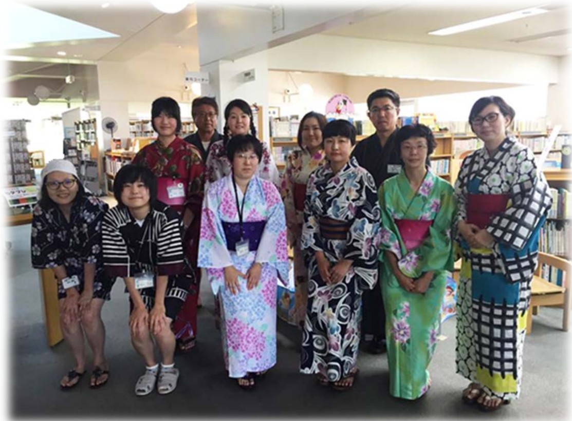
2016 夏まつり in 幕別町図書館 (p. 5 関連写真)