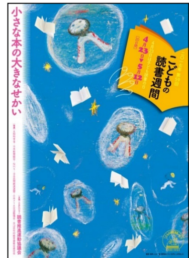
2017・第59回読書週間ポスター