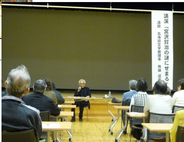
講演会実施風景（壮瞥町）