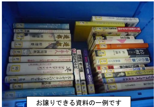
お譲りできる資料の一例です

古本市用資料として使う以外にも、まちかど文庫や移動図書として利用するなど、活用方法は自由自在です！ ご不明な点がございましたらお電話で、企画支援課までお問い合わせください！