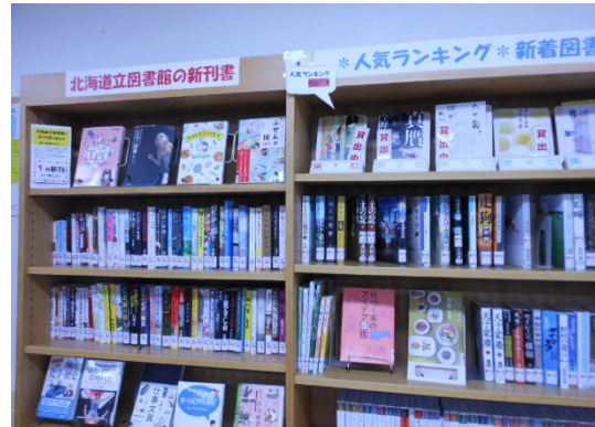
新刊書活用の様子