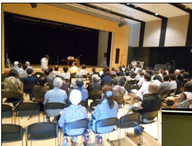
講演会実施風景（豊富町）