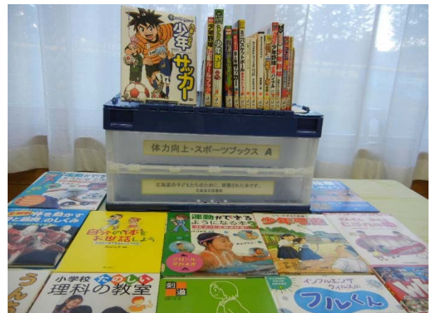
体力向上・スポーツブック