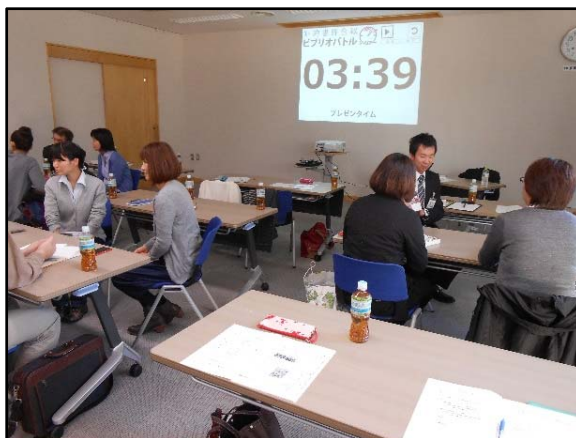
ピブリオバトル研修

（利用者の声） 道立の職員の方による研修会が、身近に行われるのは大変ありがたいです。近隣の図書館との情報交換や交流が身近になれば、今後の相互協力にも役立つと思います。