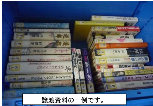
譲渡資料の一例です。

古本市用資料として使う以外にも、まちかど文庫や移動図書として利用するなど、活用方法は自由自在です！ ご不明な点がございましたらお電話で、企画支援課までお問い合わせください！