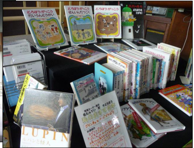
児童コーナー 名たんてい対大どろぼう