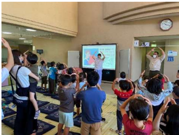
「チビッコあつまれ 読み聞かせひろば」(滝上町)