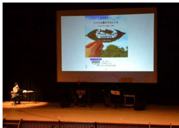
読み聞かせと合わせて行っている本紹介

始めた当初は「え？なぜ絵本??」という雰囲気でしたが、継続は力なりで、絵本は大人が読んでも面白い！ということ伝える役割は果たせていると思っています。