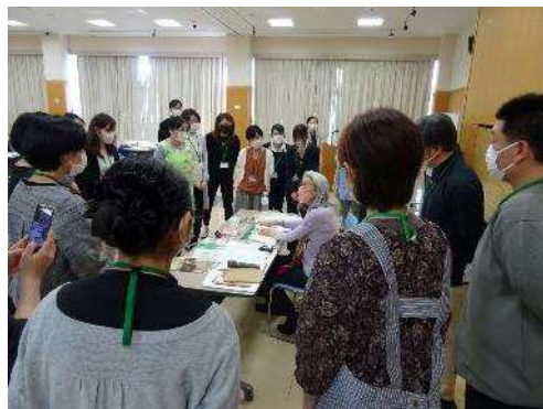
講師の実演を見学