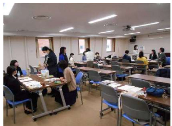
班内でブックトークを発表