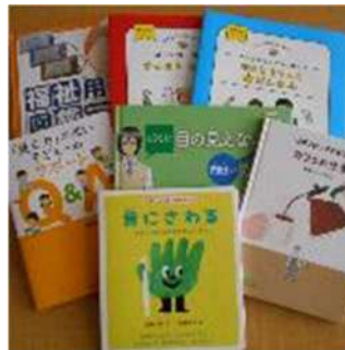
バリアフリーセットの一部