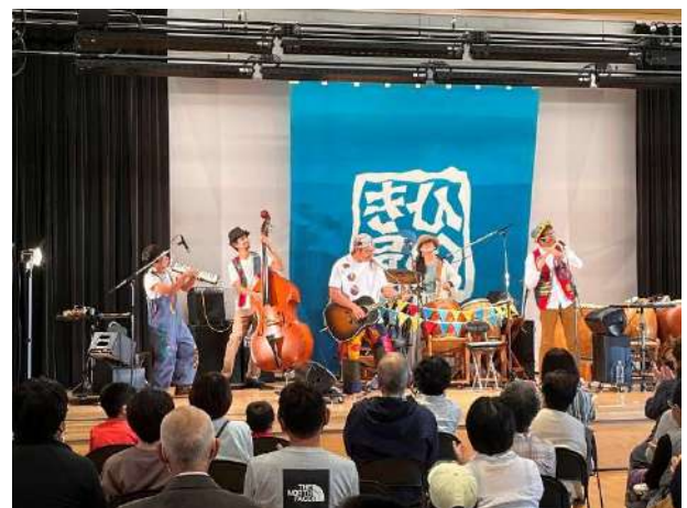
「ひのき屋」スペシャルライブ (豊富町)