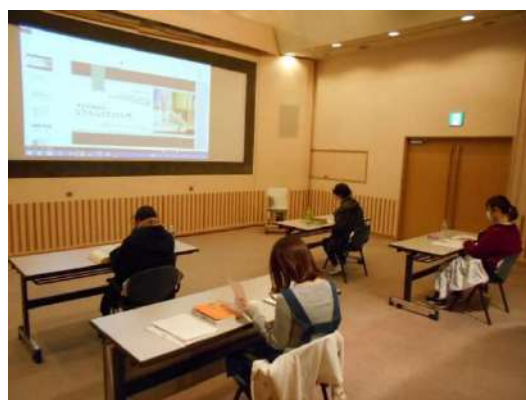
▲講義の様子 (会場は普段、会議室や視聴覚室として運用)

今回の講義を参考に、どんどんレファレンスの経験値を積み重ねていってもらえると嬉しいです！