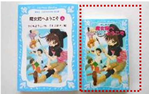
左：大きな文字の青い鳥文庫 『魔女館へようこそ (上)』 右：青い鳥文庫『魔女館へようこそ』 (どちらも) つくもようこ作、CLAMP 絵、講談社