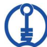
令和4年度展示内容

今年度のポスターは、職場体験やインターンシップに来た中高生の意見を参考に作成しました。多くの高校生が試験期間中にしか来館しないという厳しい現実がありますが、将来を担う若い世代の方たちにも利用されるよう、これからも継続して企画・展示してまいります。