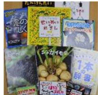
理科読セットの一部