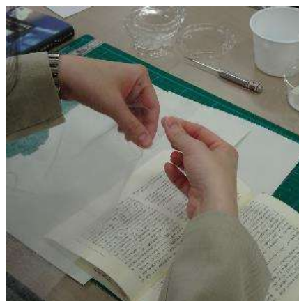
ページ破れの修理