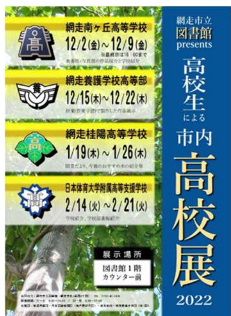
開催告知ポスター

網走市立図書館では、「利用の少ない層である高校生による企画展示を行うことで、来館促進を図ったかどうか？」との図書館協議会からの意見をきっかけに、平成25年度から「高校生による市内高校展」を開催しています。この展示は市内すべての高校にご協力いただいております。高校生の視点や考え、あるいは学校活動を紹介し、あわせて関連の図書を展示する連続展です。各校の展示期間は一週間です。