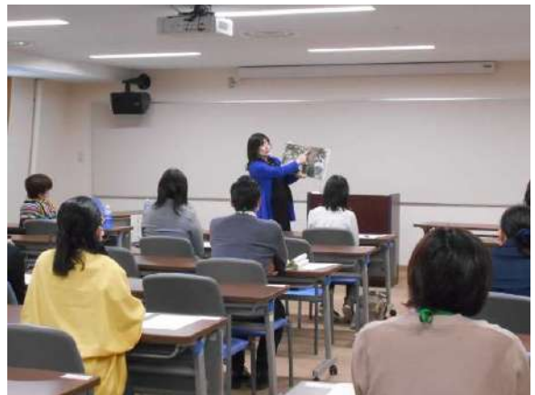
講師の実演を見学