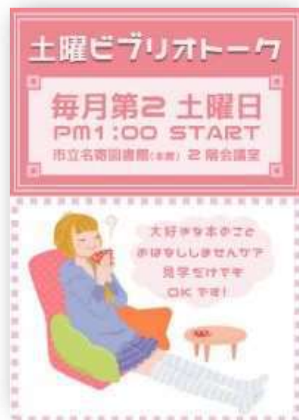
開催告知ポスター

今後はSNSの活用などによって実施状況の可視化を図り、参加のきっかけにつなげていく取り組みが必要であると感じています。今後も継続して取り組み、いつでも気軽に本について話せる場所と機会を提供していきたいと考えています。