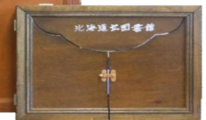
通常サイズ紙芝居舞台