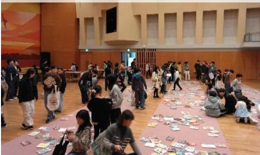
読みたい本を選ぶ時間

学校に道立図書館の児童書・絵本を提供し、おはなし会等を実施して、児童生徒に読みたい本を自由に選んで借りてもらう事業です。日ごろ読書に親しむ機会が少ない子どもたちも、友だちや先生と一緒に楽しんで本を選ぶことができ、熱心に読書を始めます。