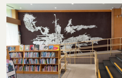
▲玄関ホールはえほんコーナーに