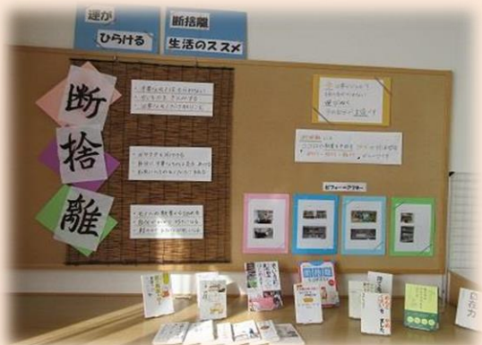
「断捨離展」（2021.1 貸出）の様子