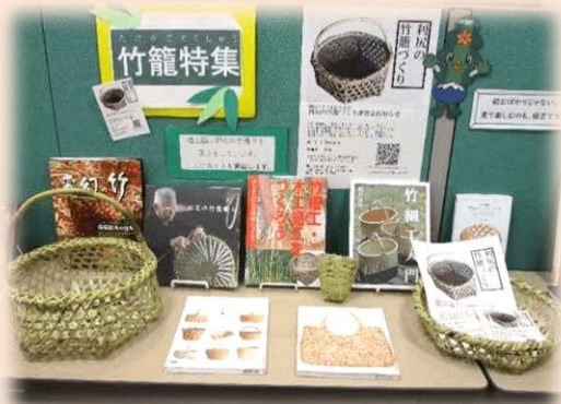
「竹籠特集」（2021.10 貸出）の様子

※利尻町で開催した「竹籠づくり講習」に合わせた企画展示で、当館から貸し出した18冊の図書のほか、講師の方が作った竹細工見本や利尻産の笹で作ったカゴなどの作品も一緒に並びました。また、大きな書店がなく現物を確認する機会が少ない離島ならではの事情から、貸出資料が竹細工関係の図書の選書にも役立つとのこと。