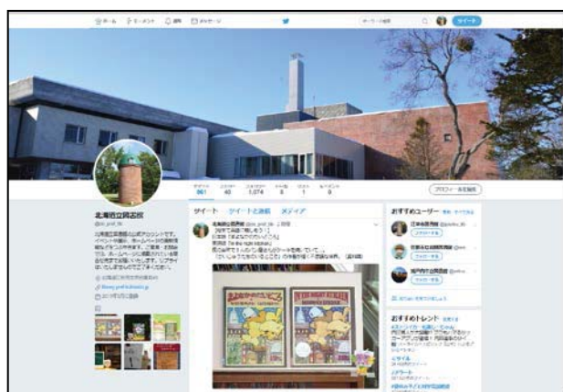
北海道立図書館ツイッター https://twitter.com/do_pref_lib

北海道立図書館ホームページ http://www.library.pref.hokkaido.jp/index.html