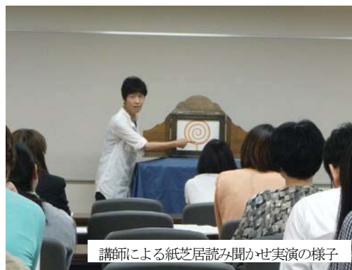
講師による紙芝居読み聞かせ実演の様子

講師による読み聞かせやイラスト作成（広報グッズ）の実演、学校図書館の現場を知る講師の実践紹介などが盛り込まれた本研修は