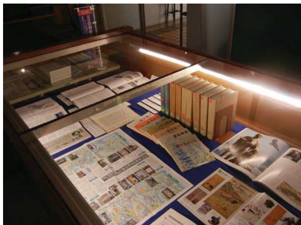
武四郎やその著作・足跡を紹介する図書や雑誌