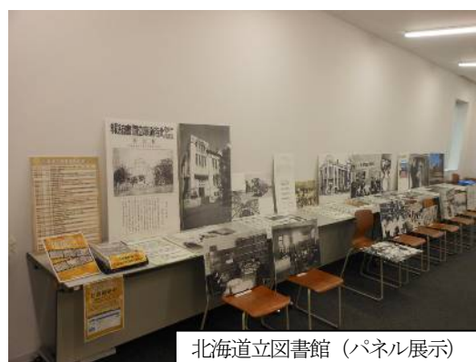
北海道立図書館（パネル展示）