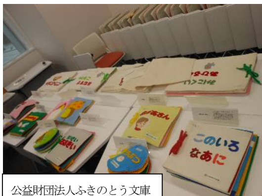
公益財団法人ふきのとう文庫