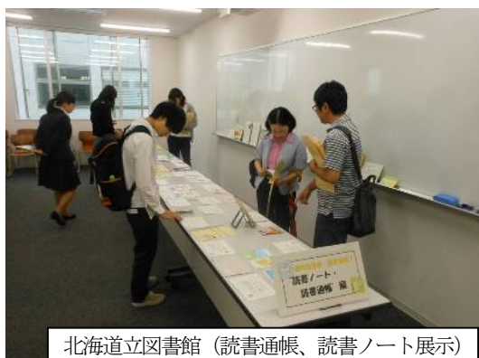
北海道立図書館（読書通帳、読書ノート展示）

北海道内の公共図書館、図書室のご協力を得て、「読書ノート」「読書通帳」など、読書記録を書き込めるノート等の実物と紹介カード（提供館記入）の展示を行いました！