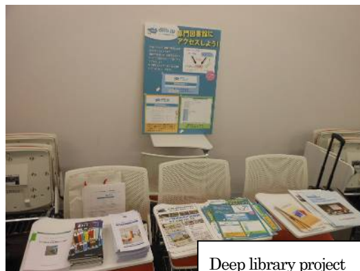
Deep library project