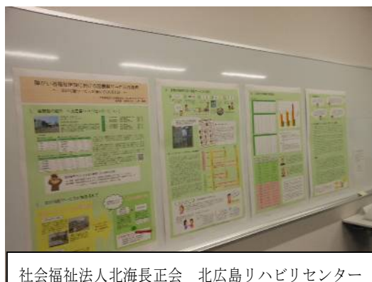
社会福祉法人北海長正会 北広島リハビリセンター