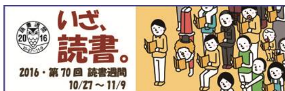
2016・第70回読書週間ポスターと標語ロゴマーク