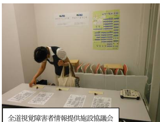
全道視覚障害者情報提供施設協議会