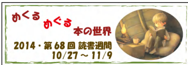
2014・第68回読書週間ポスターと標語ロゴマーク (公益社団法人読書推進運動協議会)