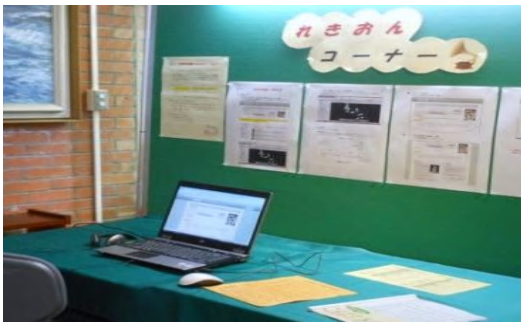
「北海道・歌の旅 ～“歴史的音源(れきおん)”を聴きながら～」