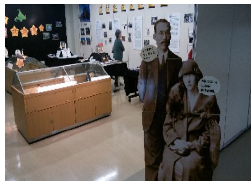
江別市情報図書館