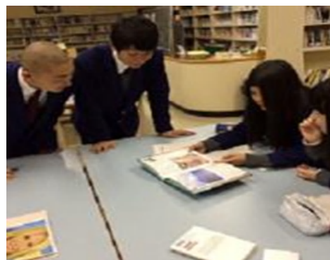
海外研修に向けての事前学習（北海道立ノ国高等学校）