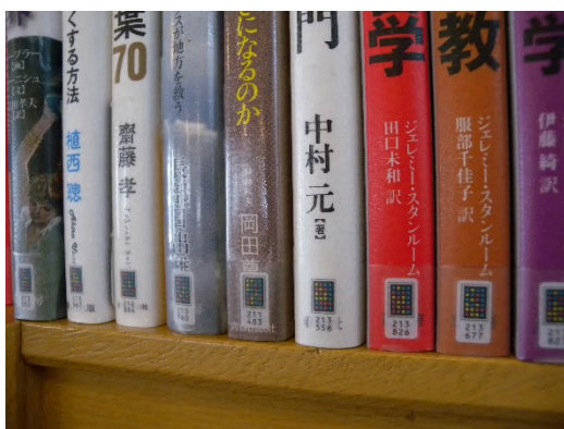
新しく導入したLENコード

前館長が就任時に抱いた図書館に対する素朴な疑問から始まったシステム改修事業は、図書館全体に大きな変革をもたらすことになりました。図書館外からきた、いわば門外漢の館長だからこそ見えた疑問が、「LENコード（カメレオンコード）」の導入につながり、さらに運用フローなど内側の課題から、地元書店との関係など外側とのつながり、地域との関係まで根本的に見直す契機となりました。