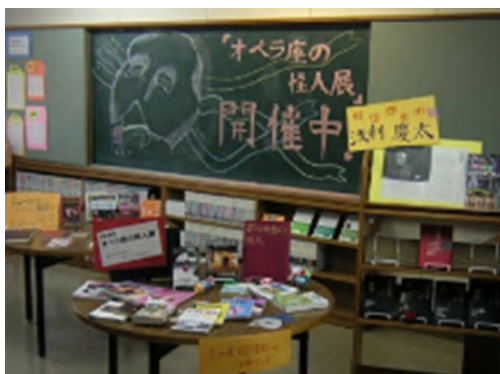
資料展示（北海道札幌手稲高等学校）

全校で行う芸術鑑賞に合わせての資料展示、海外研修に向けての事前学習等、延べ8校に323冊を貸し出しました。次年度は、利用規則を改正し、図書館間貸出しの対象館に「学校図書館」を加え、さらなる利用を推進します。