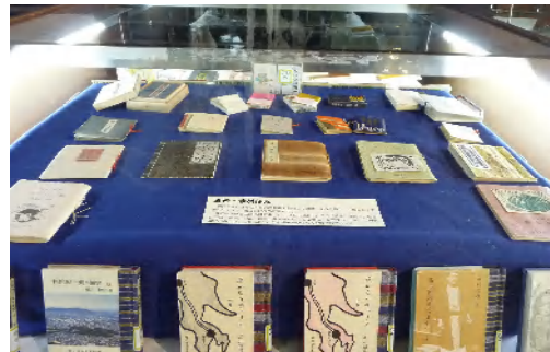
「豆本 ～小さな扉の向こうの多彩な世界～」