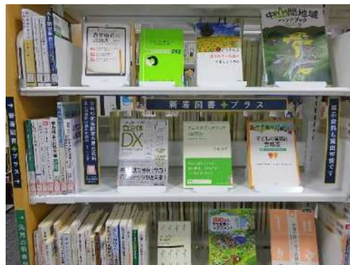
(新着図書+（プラス）コーナー)・中段