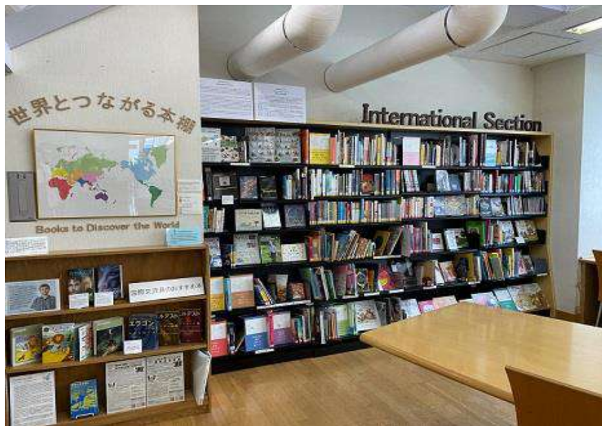
( International Section )

目の不自由な方から音源資料の貸出を求められた時、小学生の児童が調べものをしているなかで、事典（禁帯）の一部をコピーしたいと希望された時、図書館では当たり前利用できるこれらのサービスを当施設では制度上受けることができません。札幌市などの大きな都市やニセコ町と同規模の町村であっても図書館であれば、これらのサービスを利用者はあたりまえのこととして受ける事ができます。図書館同種施設と図書館、一見そう違いはないように見えますが、誰もが平等に利用できる施設として不十分ではないか、地域による社会教育環境に格差を生じさせているのではないかという疑問が、図書館にしなければならないという確信につながっていきました。この課題点を町も同様に受け止め、条例図書館としての設置の実現に結びつきました。