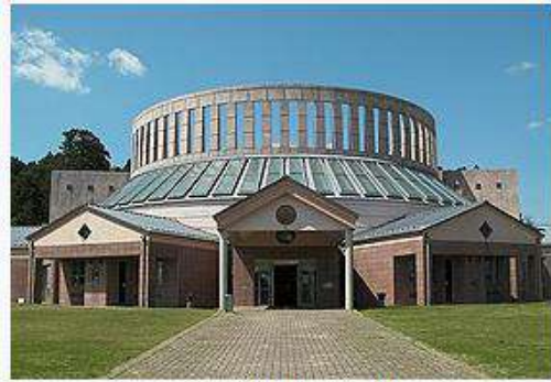
(水戸市立西部図書館の外観)