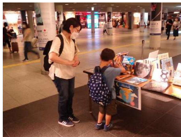
（宇宙や大地の生きものに関する絵本を展示）