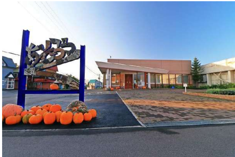
(ニセコ町学習交流センターあそぶっく外観)

「本の読み聞かせの会」が組織され、ボランティアグループは、それらの活動を通し、より充実した施設として図書館の設立を町に働きかけるよ