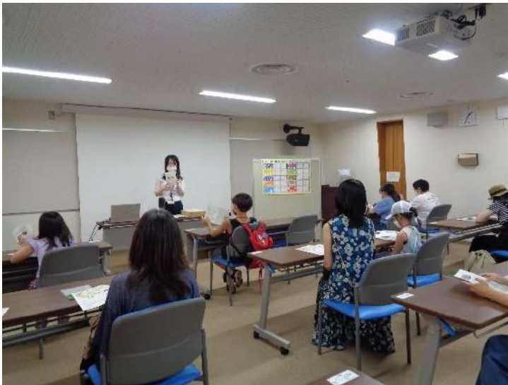
(本の探し方について説明)

小学生の夏休み期間に合わせて、「図書館の秘密を探せ！子ども向け書庫ツアー」を開催しました。昨年は、新型コロナウイルス感染拡大防止のため、中止としましたが、今年はマスクの着用等の対策を行った上で実施し、当日は小学生と保護者合わせて計18名の参加がありました。始めに研修室で、本の探し方についての説明と館内紹介DVDを視聴後、普段は入ることができない第一書庫