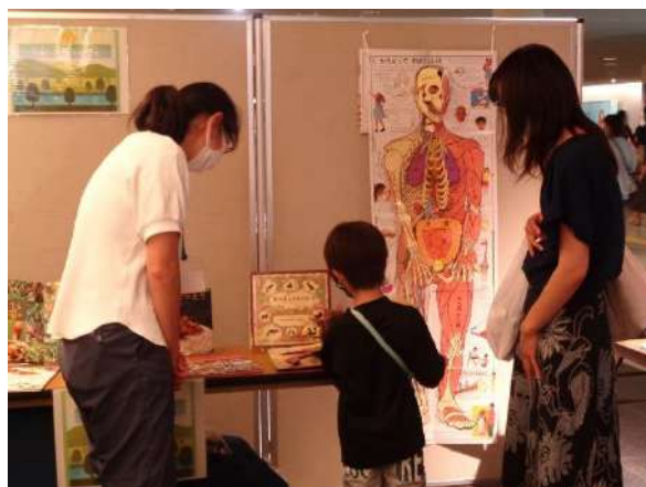
（ポップアップ人体絵本等、しかけ絵本が人気）