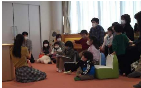
(「新春おはなしリレー」の様子)

オープニングイベントは、体験型イベントなどのほか、図書館内では「世界のしかけ絵本展」「室蘭の歴史を知ろう！展」「としょかんガチャ」などを実施。また、年明けにはボランティアやFMラジオパーソナリティの方々にも参加いただき「新春おはなしリレー」などの行事も開催しました。