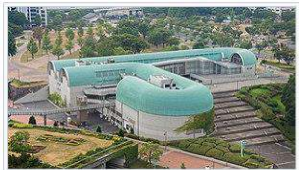
(北九州市立中央図書館の外観)