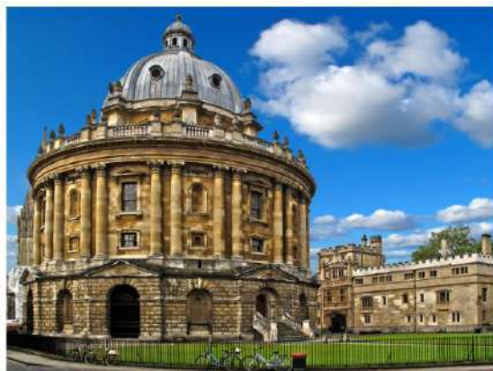
(ボドリアン図書館 (ラドクリフ・カメラ) の外観)

また、ヨーロッパでも有数の歴史を持つ図書館で、イギリスゴシック建築の傑作である「オックスフォード大学 ボドリアン図書館（1598年築）」は、「ハリーポッター」シリーズの撮影にも使用されています（ホグワーツ魔法魔術学校の大広間や図書館として使用）。