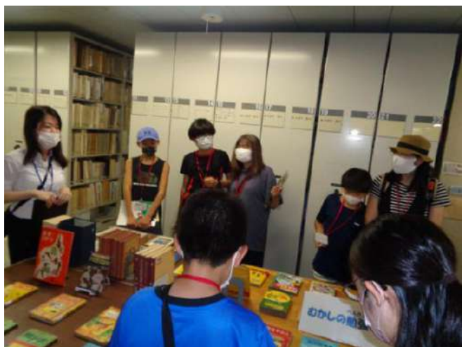
(第二書庫で雑誌や新聞を紹介)

今回の書庫ツアーは、90分間という長い時間での開催でしたが、楽しみながら本や図書館を身近に感じてもらえる良いきっかけになったようです。