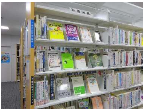
(新着図書コーナー)

以前は離れたところに分けて置いていましたが、今年度は道議会図書室購入の新着図書コーナーと同じ棚でより分かりやすくなり、一般の方も手に取ってゆっくりご覧いただくことができます。