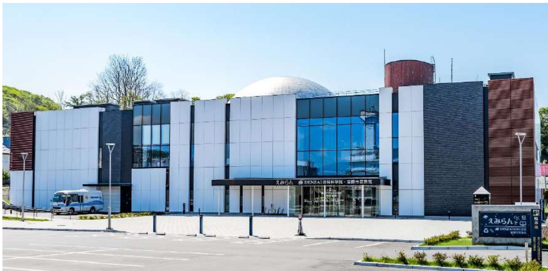
(上/えみらん外観 下/室蘭市図書館入口)

昨年12月、DENZAI環境科学館と室蘭市図書館の合築施設「えみらん」が誕生しました。