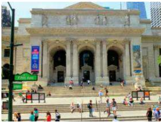
(ニューヨーク公共図書館の外観)

図書館は、国内外を問わず、映画の舞台にもなっています。特に欧米を中心とする海外の図書館には、魅力的な建物の図書館が多いため、しばしば、映画の撮影場所として使用されています。有名なところでは、全米屈指の美しい建造物で、かつ700人も収容することができる閲覧室を有する「ニューヨーク公共図書館（1911年築）」は、「ティファニーで朝食を（1961年）」「ゴーストバスターズ（1984年）」「デイ・アフター・トゥモロー（2004年）」「スパイダーマン（2002年）」など、多くの作品の舞台になっています。