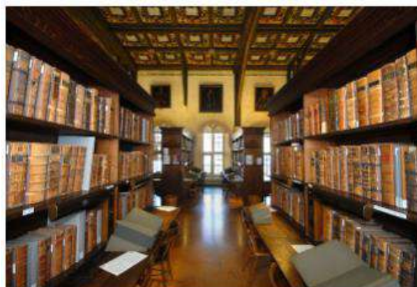
(ボドリアン図書館 (ハンフリー侯爵図書館) の内部)

国内に目を向けると、「図書館戦争（2013年）：水戸市立西部図書館・北九州市立中央図書館」や「君の名は（2016年）：飛騨市図書館」といった映画（アニメを含む）が、ユニークな建造物である図書館を舞台に創られており、聖地巡礼として、多くのファンがそうした図書館を訪れているようです（残念ながら道内の図書館には映画の舞台となるような図書館はあまりないようです）。