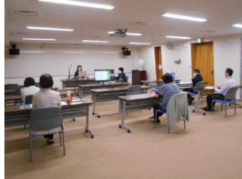
(オンライン運営の様子)

この研修会は、図書館運営・企画能力の向上、変化する図書館ニーズに対応できるスキルの習得を図ることを目的に、道内の公立図書館、公民館図書室等に勤務して3年以上の職員を対象として実施しています。今年度は、「コロナ後の図書館」をキーワードに、オンラインで開催しました。