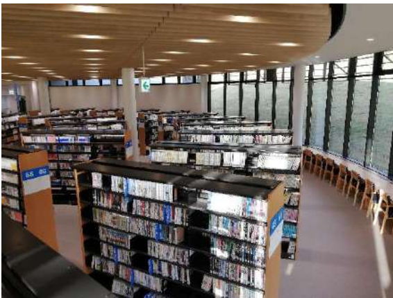
(室蘭市図書館 館内)

科学館との合築という全国的にも珍しい複合形態ですが、科学館は土日祝日や春夏秋冬休み期間の家族での利用が多い施設、一方の図書館は常時幅広い年齢層の利用がある施設であり、2施設が一体化している事で、現在は、2世代3世代の家族みんなで来館し科学館と図書館の両施設を利用するという姿も見られるようになり、一定の相乗効果が現れているのを感じます。