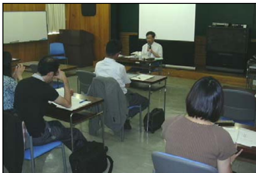
←3日目の講義風景より