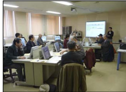
「インターネット活用術」の様子

インターネットを利用して自宅で調べ物をされる利用者の方が増えています。「インターネット活用術」は実際にパソコン操作を行い、実習形式でネット情報の上手な活用法を学びます。今年度は、平成 22 年 12 月 1 日に「放送・映画編」、同 15 日に「雑誌・新聞編」を北海道立教育研究所附属情報処理教育センターで開催し、合わせて 21 名が参加されました。