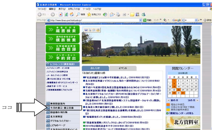
当館ホームページのトップページ

これらのコーナーのほかにも、北方資料室内、閲覧室(窓辺の本棚)、児童コーナー、開架書庫などで随時展示を開催します。毎月の展示につきましては、当館ホームページ「今月の展示」で紹介しています。