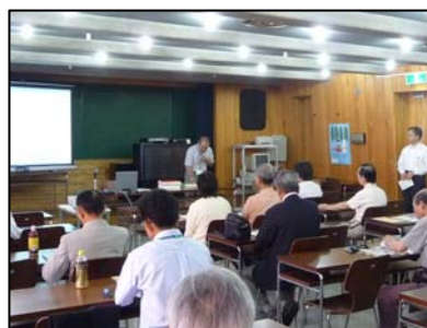
「暮らしに役立つ図書館活用術」の様子

平成21年5月21日に「基礎編」、6月25日に「応用編」を当館1階研修室で行いました。「基礎編」は図書館で行なっているサービスと、暮らしに役立つ参考図書を紹介。「応用編」は雑誌・新聞資料の調べ方をテーマに、図書館の資料等から調査する際の基礎知識を紹介しました。合わせて25名の方にご参加いただきました。