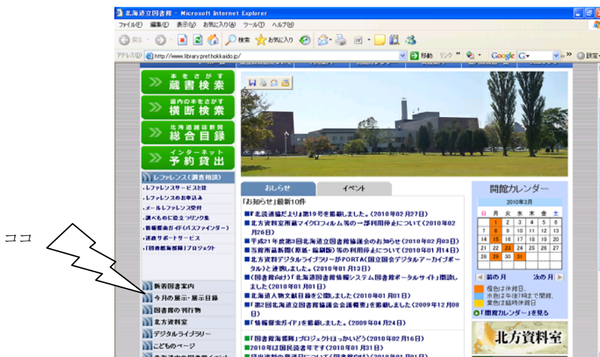
当館ホームページのトップページ

これらのコーナーのほかにも、北方資料室内、閲覧室（窓辺の本棚）、児童コーナー、開架書庫などで随時展示を開催します。毎月の展示につきましては、当館ホームページ「今月の展示」で紹介しています。