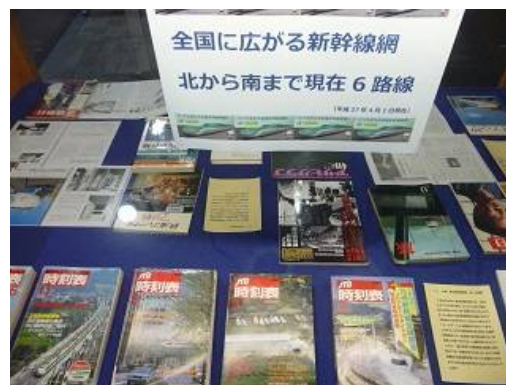
「ようこそ北へ 新幹線と歩んだ日本の半世紀」 5月30日（土）～8月27日（木）