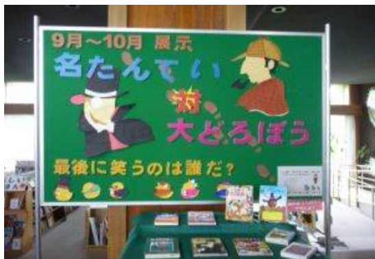
「名たんてい対大どろぼう」 8月29日（土）～11月26日（木）

多くの方々が図書館資料を利用され、読書に親しみ日々の暮らしに役立てていただければ幸いです。