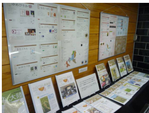
「知れば知るほど、北海道米」