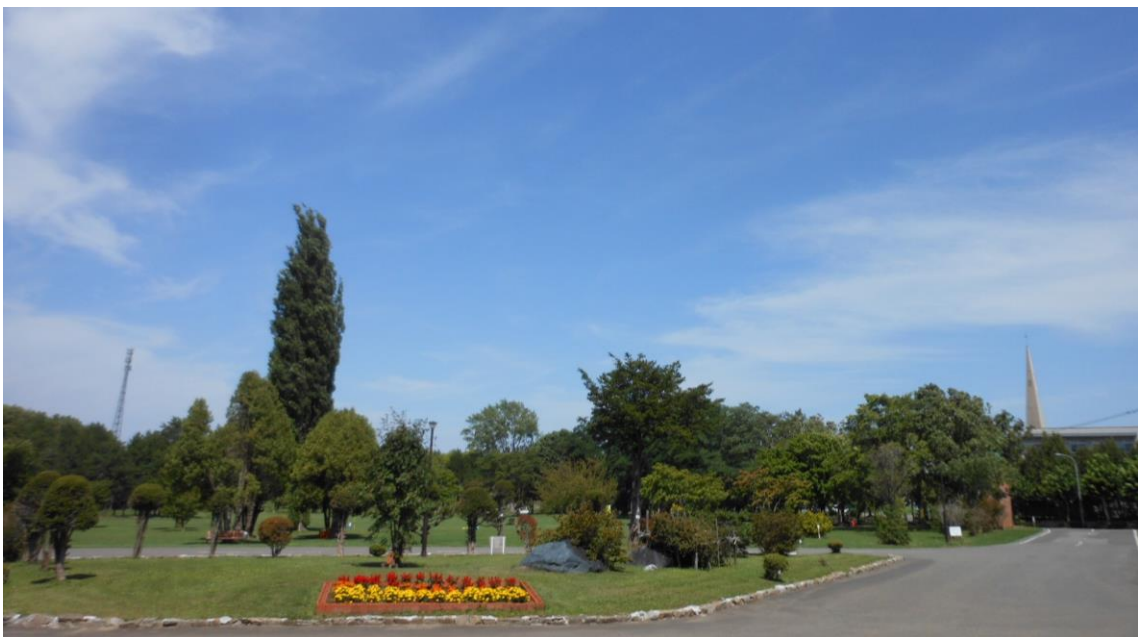
(北海道立図書館 前庭 令和3年8月撮影)

敷地内で一番大きく目に付くのがポプラです。青空に向かって2本、堂々とそびえている風景は北海道らしさ満点で、酪農学園大学附属とわの森三愛高校の礼拝堂の十字架を借景にすると、異国情緒まで感じると言ったら、ややおおげさでしょうか。