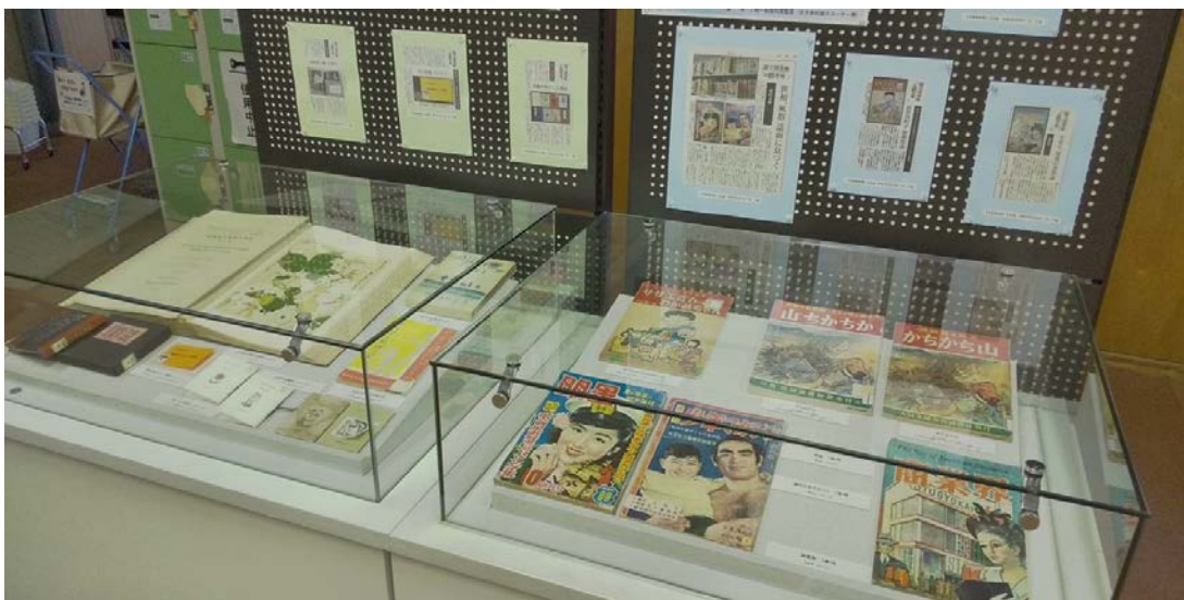
北海道立文書館からお借りした素敵な展示ケースに並べられた“お宝資料”の数々