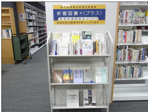
新着図書+ (プラス) コーナー

新着図書コーナー棚のすぐ左手に「新着図書+ (プラス)」としてコーナーを設置し、30冊ほどを展示しており、一般の方も道議会図書室内で、手にとってゆっくりご覧いただくことができます。