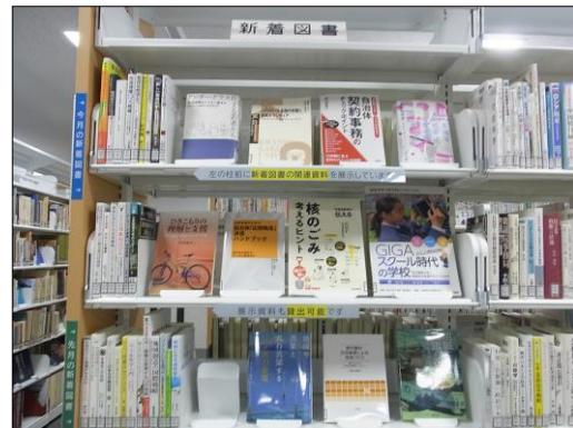
新着図書コーナー