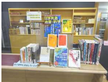
「千島海溝型超巨大地震への備えと防災・減災対策」

9月5日(月)から9日(金)までは研修会「千島海溝型超巨大地震への備えと防災・減災対策」に関連した資料展示、12月14日(水)から28日(水)までは講演会「新たな公共交通への取組みについて」に関連した資料展示を行いました。