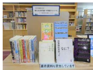
「新たな公共交通への取組みについて」