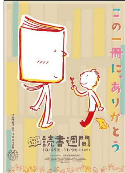
2022・第76回読書週間ポスター （公益社団法人読書推進運動協議会）