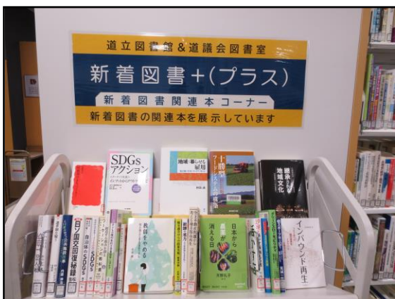
新着図書+（プラス）コーナー

当館と道議会図書室の連携事業のひとつとして、道議会図書室で毎月購入する新着図書に合わせて、関連する分野の当館所蔵図書を展示しています。「新着図書+（プラス）」のコーナーとして、まちづくりや防災、SDGs、感染症に関する本などを展示し、一般の方も道議会図書室内で手に取ってご覧いただいています。毎月の展示資料リストは、当館ホームページの「インフォメーション」 「展示」 → 「北海道議会図書室連携展示」 からご覧いただくことができます。