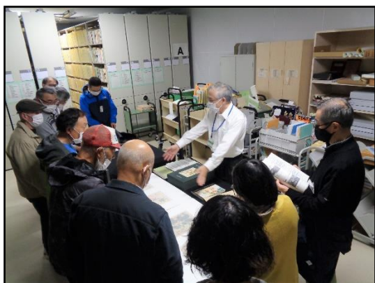
北方資料室書庫で古い地図を紹介