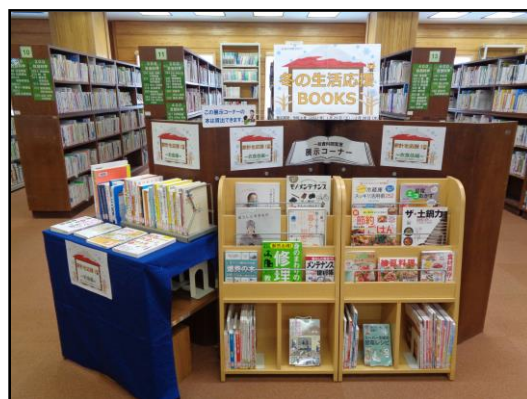
(一般資料サービス課)

寒さに加え、今年の冬の生活に大きな影響を与えている燃料や食品等の価格高騰。そこで、「家計と健康を応援」をテーマに、そんな冬の生活を元気に乗り切るヒントが見つかった、いろいろなジャンルの本約180冊を展示しました。