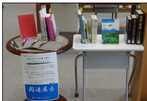
関連資料展示は密を避けて北方資料室内で実施

中盤では、国立アイヌ民族博物館アイヌ語アーカイブから音声を流し、参加者みんなでアイヌ語を書いてみることにチャレンジし、アイヌ語には日本語と異なる音があることを体感しました。tuの音を「ト」、-pの音を「ッ」など、書き表し方に工夫が必要だったことにも納得できたようでした。