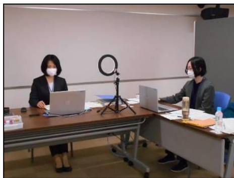
オンライン運営の様子