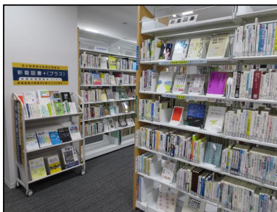
新着図書コーナー