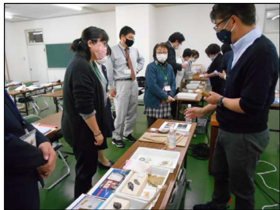
講演「地域の歴史を身近に」