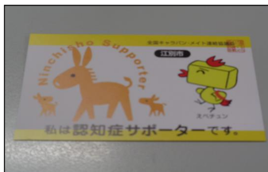
(研修プロジェクトチーム)