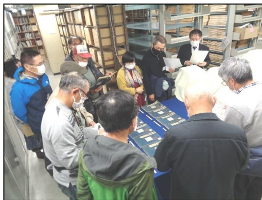
第1書庫地層で旧分類資料を紹介

終了後のアンケートでは、「初めてこちらに来ることができ、書庫の中も見られてとても楽しかったです」、「時代の古い本がたくさん保存されていることに感心しました」、「どれも興味深い資料でいっぱいでした」等の感想をいただきました。