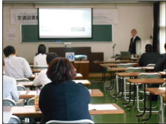
講義「明日からはじめる地域資料のSHK」