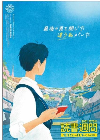
2021・第75回読書週間ポスター （公益社団法人読書推進運動協議会）