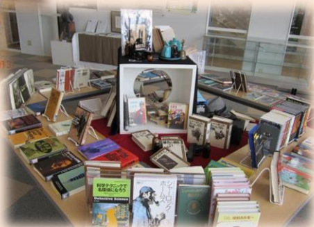
〈あなたの身近な名探偵〉展