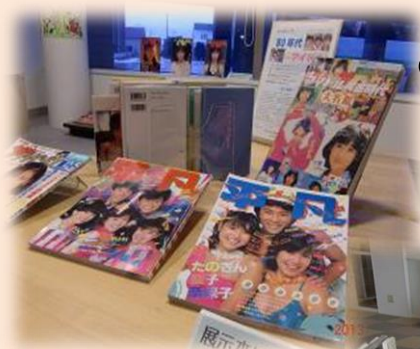
〈思い出の 80年代アイドル〉展

「本」や「雑誌」をまとめて貸出し、「魅せる展示」をサポートします。 テーマ設定の相談もおよせください。