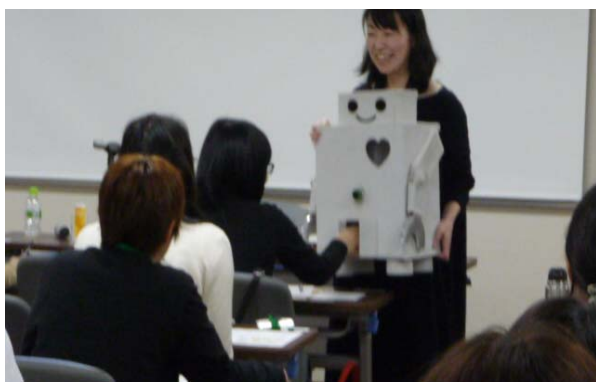
全道図書館新任職員研修会に出張した「ガチャっとくん」