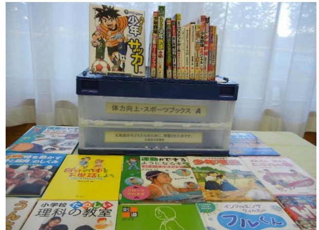
体力向上・スポーツブック