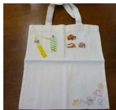
オリジナル図書館バッグ （左上はキーホルダー、右上はバッジ、右下はスタンプ）

「ガチャッとクイズ2」について詳しくは由仁町ゆめっく館ホームページをご覧ください。