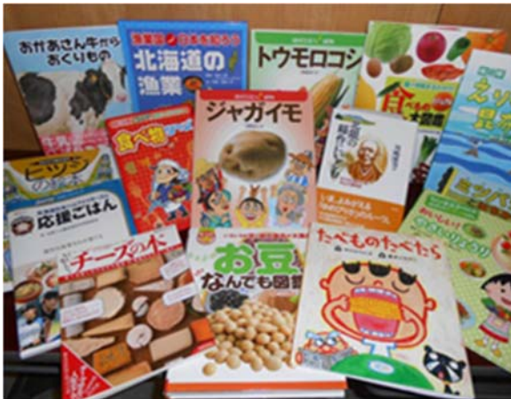
愛食・食育ブック

( https://www.library.pref.hokkaido.jp/web/publish/guinh00000003hhb-att/vmlvna0000000nha.pdf )