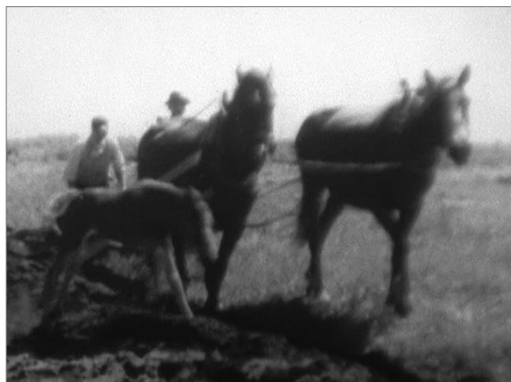
「北海道の開拓 入植編」(1951)より

また、市町村を紹介した65作品については、各3分にまとめたダイジェスト版を当館ホームページ中のデジタル・ライブラリーで公開しています。